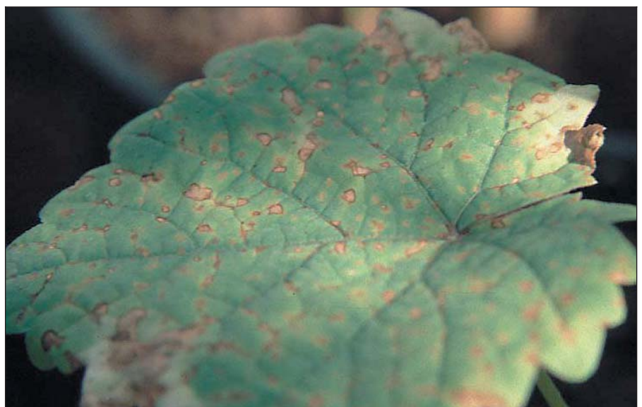
Nekrosen als Abwehrreaktion gegen Peronospora -Infektion am Sämlingsblatt.

Aus züchterischer Sicht und zur Vereinfachung des Verständnisses lässt sich dem modernen Ziel der Pilzwiderstandsfähigkeit von Neuzüchtungen folgend die Einteilung der für die in der Kreuzungszüchtung zu verwenden Sorten in pilzanfällige und pilzwiderstandsfähige Elternsorten vornehmen. Für die Verwendung als Kreuzungseltern stehen in unserer Rebenzüchtung derzeit rund 1000 Rebgenome zur Verfügung.