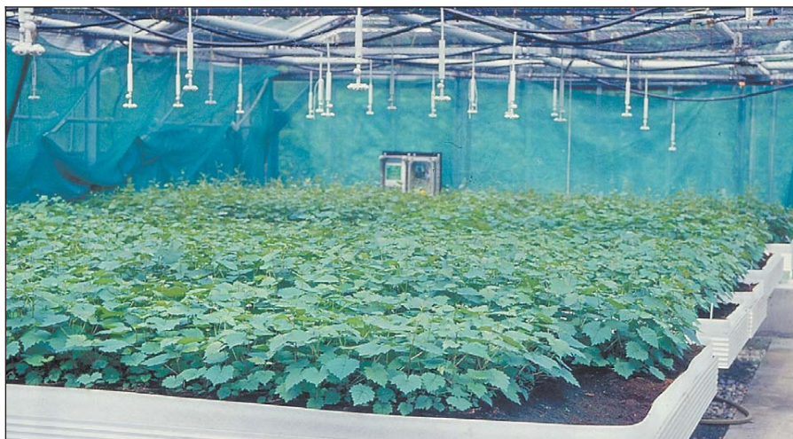
Sämlingsanzucht im Stadium der Pero-Infektion.

Die Dynamik in der Rebpfanzgutnachfrage nach unseren pilzwiderstandsfähigen Rebsorten der zurückliegenden vier Jahre ist im Wesentlichen auf die sehr starke Nachfrage der Weinwirtschaft und der Weinkunden nach farbintensiven Rotweinen des Profils romanischer Rotweine zurückzuführen. Wir können heute pilzwider-